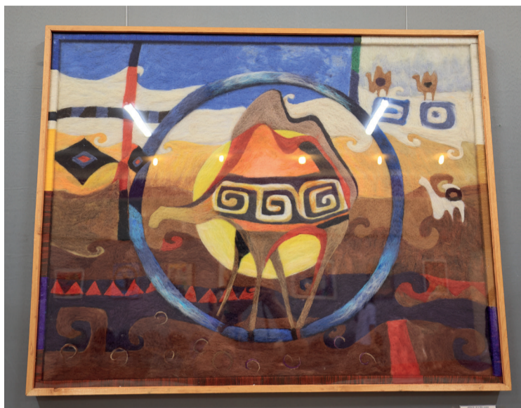
ұлттық бояу мен тарихи үндестікті шебер үйлестірген.

пақ сабақтастығы мен тіршіліктің үздіксіз жалғасын сипаттайды. — Әрбір жіптің қиылысы — ата-бабамыздың аманаты. Бұл туындыда өсіп-өркендеу, өмірдің жалғаса беруі деген терең мағына жатыр, — дейді шебер. Көпшіліктің ықыласына бөленген туындылардың тағы бірі — «Жібек жолы» атты киіз туындысы. Автор бұл еңбекте қазақ халқының көшпелі өмірін, байырғы өрнек мәдениетін,