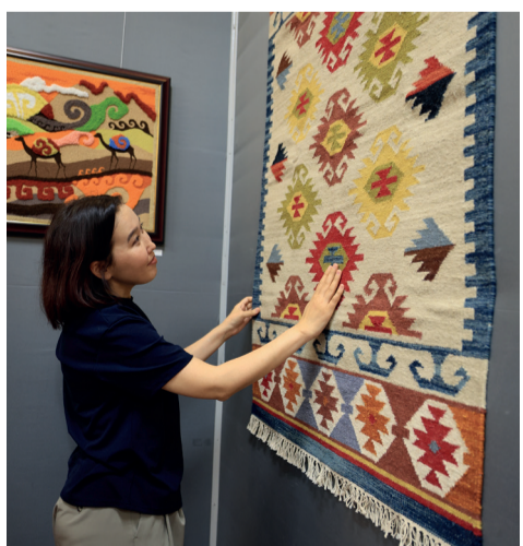
Әселдің тоқып жатқан кілемі «Қарлығаш» деп аталады. Туындыда әйел өмірінің кезеңдері мен нәзік болмысы түрлі түстер мен белгілер арқылы бейнеленген.