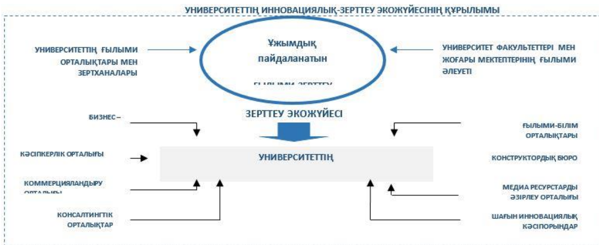
УНИВЕРСИТЕТТІҢ ИННОВАЦИЯЛЫҚ-ЗЕРТТЕУ ЭКОЖҮЙЕСІНІҢ ҚҰРЫЛЫМЫ