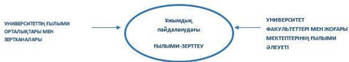
3-сурет. Зерттеу экожүйесі

ҰПҒЗО құру ғылым мен технологияны дамытуға, ғылымды, білім мен бизнесті интеграциялауға байланысты міндеттерді шешудегі жалпы әлемдік үрдіс болып табылады.