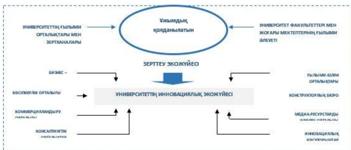
4-сурет. Бірыңғай инновациялық экожүйе

Құрылатын зерттеу экожүйесі университеттің қолданыстағы зерттеу және инновациялық экожүйесімен интеграцияланады. Интеграция барысында қолданыстағы ғылыми-зерттеу экожүйесі жаңғыртылып, қайта құрылады, ол өз кезегінде зерттеу университетінің негізін құрайтын бірыңғай инновациялық зерттеу экожүйесі болады.