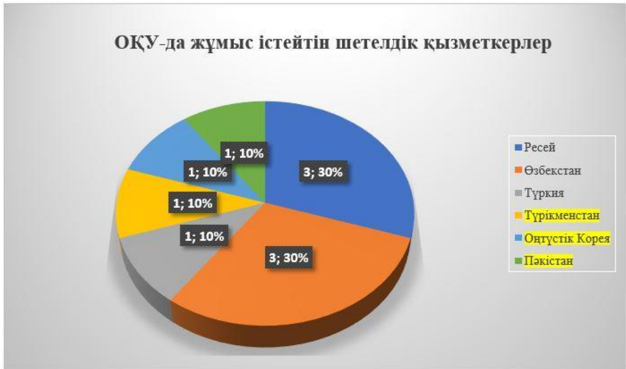
1-сурет. ОҚУ-да жұмыс істейтін шетелдік қызметкерлер (2021 - 2023 жж.)

Үш тілді немесе ағылшын тілді топтарда сабақтарды ұйымдастыру үшін шет тілін меңгерудің жалпы еуропалық құзыреттеріне сәйкес шет тілін меңгергенін растайтын халықаралық сертификаттары бар оқытушылар тартылады (IELTS (АЙЛТС); TOEFL IBT (ТОЭФЛ АЙБИТИ); TOEFL ITP (ТОЭФЛ АЙТИПИ)). Қосымша білім беру орталығы жыл сайын ОПҚ және университет тыңдаушылары үшін CLIL (КЛИЛ) технологиясы бойынша 72 сағаттық курсты ұйымдастырады және өткізеді.