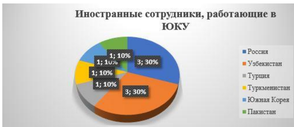
Рисунок 1- Иностранные сотрудники, работающие в ЮКУ (2021 – 2023 гг.)

За последние три года количество иностранных сотрудников и преподавателей составило 10 человек.