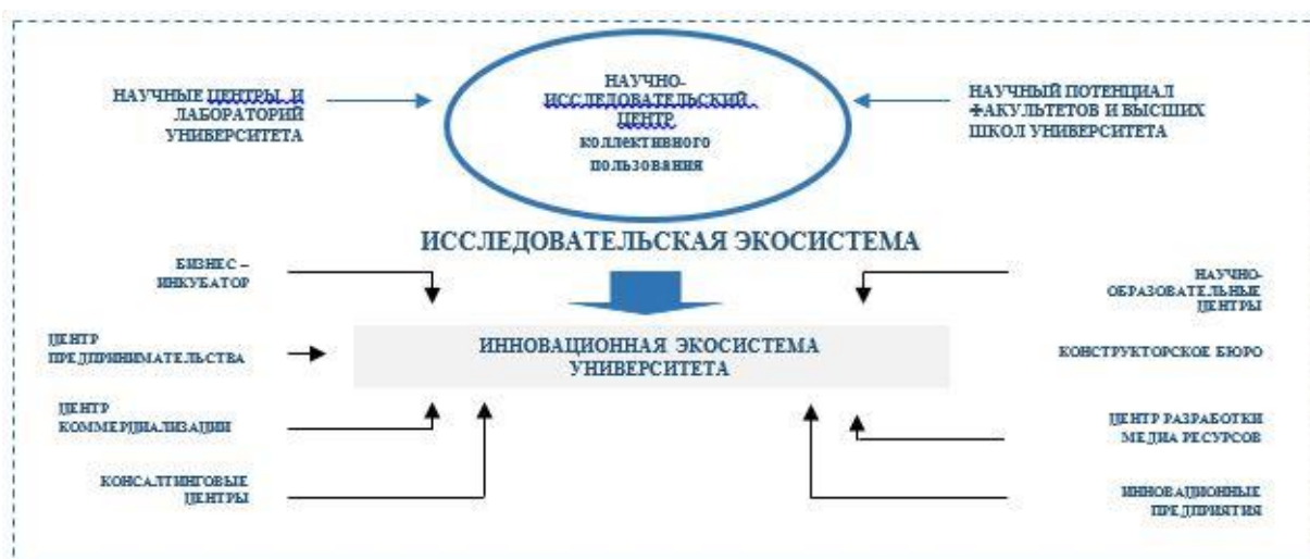
Рисунок 4. Единая инновационная экосистема

Созданная исследовательская экосистема будет интегрирована с существующей исследовательской и инновационной экосистемой университета. В ходе интеграции будет модернизирована и реорганизована существующая и создана единая инновационная исследовательская экосистема, которая составит основу исследовательского университета.