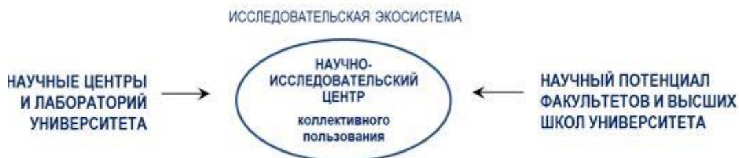
Рисунок 3 - Исследовательская экосистема

Согласно идее Программы основным ядром создаваемой в ЮКУ инновационной исследовательской экосистемы (рисунок 3) будет научно-исследовательский центр коллективного пользования.