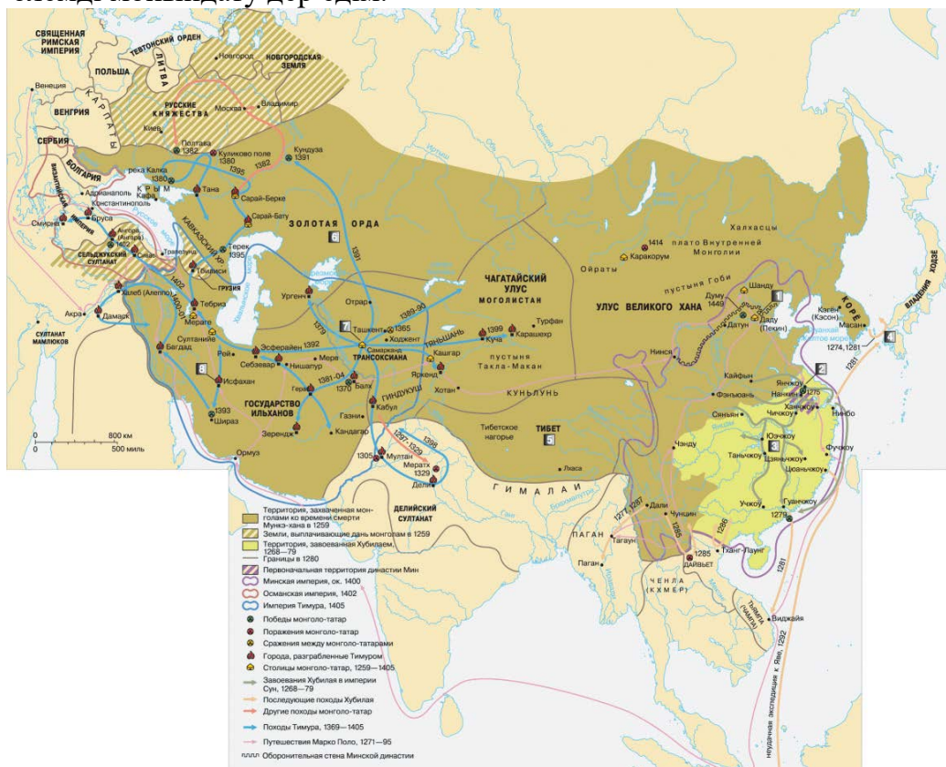
Сурет 3. Түркі империясы

Б.з.д. VI-V ғасырларда Түркі қағанатының әлемдегі ең үлкен армиялардың бірі болған II Кир мен Дарий патшалардың әскеріне қарсы тұруы, б.з.д. VI-V ғасырларда Еуропаны жаулап алуы, ал XIII ғасырда жарты әлемді алуы, бір Құбылайдың өзі ұрпақтарымен Пекинде отырып Қытайды 100 жыл басқаруы және т.б. – әлемді мойындату дер едім.