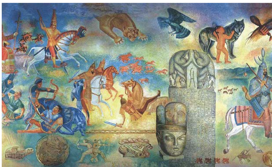
1 сурет. Ашина

Мұндай әлемде болмаған феноменді ашу үшін тарихи деректерге сүйенейік. Түркі халқы азғантай Ашина әулетінен, Монғол Алтай жерінен шыққан күрескер, өжет тайпа болған. Ашина сөзі «благородный волк» деген сөз. Қытайлар оларды – ту-кю, түркі деп атаған. Негізінде түркі сөзі «күшті», «мықты» деген сөз екен [5]. Қытайдың көне деректері мен басқа да жазбаларда айтылатындай, ғұн тайпасы шайқаста түгел қырылғанда 9 жасар бала тірі қалып, одан қасқыр буаз болып, Алтайға кетіп, он бала туған (сурет 1).