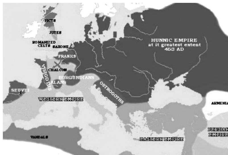
2 сурет. Ғұн империясы

Потомки тюркских шангюев (386- 550 жж. б.з.д.) становясь во главе Китайских династий считали, что тюркская племена должны быть раздроблены, изолированы, друг от друга, в ином случае они могли «перевернуть с ног на голову весь Китай» [9]. XII ғасырдағы Шыңғысханның және ұрпақтарының іс-әрекетін еске түсіретін болсақ, расымен де, солай болған. Мысалы, Шыңғысханның немересі Құбылайхан өз ұрпақтарымен алпауыт Қытайды Сун империясымен қоса Пекинде отырып, жүзжылдан аса билеген. (1256- 1360 ж.) Ол Қытайдың экономикасының гүлденуіне және өркениетіне зор үлесін қосып, жаңа қала Ұлы Астана деген атаққа ие «Тайтуды» салдырды, Вьетнам, Бирма, Камбоджаны да алды, халықты күрішпен қамтамасыз ететін арналар жүйесін құрды және т.б. Шыңғысхан Корея мен Қытайды алуға жанқиярлық ерлік жасаған, өзінің оңқолы жалайыр Мұқалиға «сен оларды вассал ретінде ұстап басқар», - деп тапсырған.