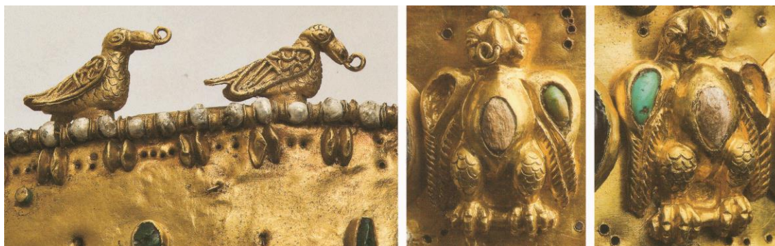
Рисунок №3 – Украшения и вставки сарматской диадемы

остатки светлой стеклянной пасты. Снизу фигурки птиц имеют овальной формы подставку, при помощи которой они прочно припаивались к диадеме.