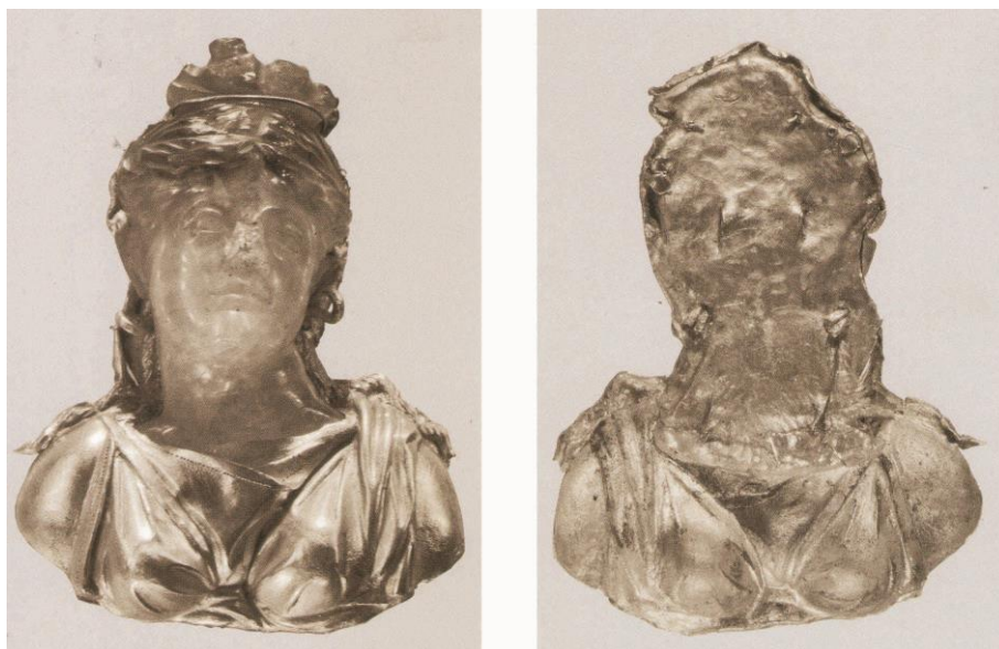
Рисунок №2 – Центральное украшение сарматская диадемы

Но, решив еще раз просмотреть тексты публикаций диадемы, я нашла упоминания данного факта у Н. Борисяка, первым описавшим находки из Хохлача. К широкой нижней части основы гнезда припаяна выступающая часть оправы в виде женского бюста с обнаженными плечами в античном хитоне. Эта деталь была сделана отдельно в технике басмы. Голову женщины украшает золотой венец с крупной вставкой граната в гнезде-лоточке и листьями сельдерея по сторонам. Венец состоит из согнутой ковanej пластины с сужающимися концами и расположенной сверху, поперек, прямоугольной пластины, короткие стороны которой загнуты кверху и имеют зубчатый край. Обе пластины соединены между собой узкой золотой ленточкой, продетой сквозь круглые отверстия и завязанной «бантом» на оборотной стороне.