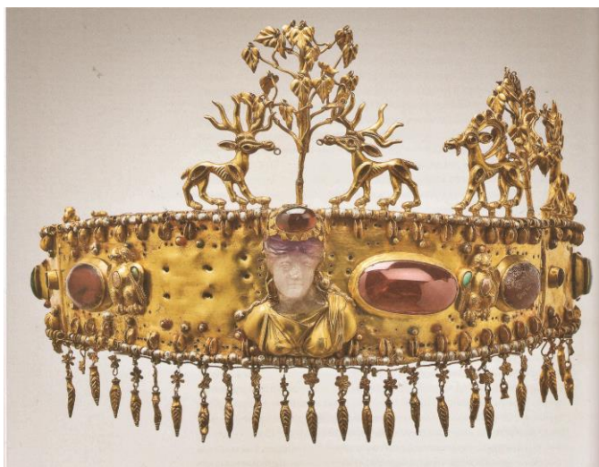
Рисунок №1 – Сарматская диадема

Каждая часть диадемы состоит из двух золотых пластин - наружной (лицевой) и внутренней (оборотной). Сверху и снизу к лицевым пластинам припаяны золотые полоски, края которых были согнуты под прямым углом и опущены вниз. Таким способом образовалось пустое пространство между двумя пластинами, которое, как мы увидим далее, оказалось заполненным черной смолистой массой. Наверху с внутренней стороны лицевых пластин припаяны свернутые из золотого листа короткие трубочки, их диаметр равен величине отверстий, сделанных в верхней горизонтальной плоскости. Трубочки служили для крепления фриза. Учитывая многообразие технических приемов в изготовлении декоративных деталей диадемы, остановимся подробнее на каждой из них.