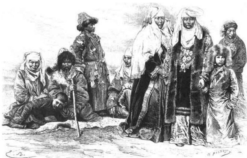
Типы инородцев. Группа киргизов. Из фот. гал. Таарс, грав. Бергман.

В указанном источнике дается описание традиционной одежды кочевников «Главную одежду киргиза составляет халат-бумажный или полушелковый. Они любят русский ситец, расписанный разными цветами, богатые носят под халатом длинную рубашку до пят, на бритой голове тюбетейка, а на ней шапка – летом войлочная, зимой меховая, на кожаном поясе подвешены мешочки, сумочки с ножом, огнивом и кремнем. Киргизки одеваются так же, как и мужчины, только покрывают голову белым покрывалом» [16].