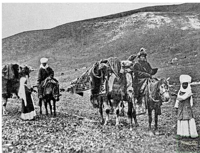
Рисунок 4. Фрагмент из перекочевки казахов

В исследованиях Абаза К.К., было представлено описание подготовки к перекочевки казахского аула . Как проанализировал автор перекочевка – было лучшим временем для населения, которое имело более праздничный характер. Мужчины, женщины, девушки, дети ехали верхом на лошади, на которых также перевозились домашняя утварь. Вьючные животные обвешивались бухарскими коврами, войлоком, красочными лентами, бубенцами, что поощряло молодое поколение. «Все радуются в ожидании полакомиться жирной бараниной. Женщины и девушки наряжаются в лучшие одежды, замужние женщины прикрепляют сзади пояса разноцветные попоны, прикрывающие у лошадей крупы, мужчины подпоясываются кушаками в серебряной оправе, в руках дорогие нагайки, шегольские уздечки и седла сплошь покрыты золотом, серебром и драгоценными камнями. Поход открывают старшины, знакомые с местом перекочевки, за ними гонят стада баранов, рогатого скота, табуны лошадей и верблюдов, сзади все мужское население, женщины и вьючные животные, в хвосте каравана – работники. В какой-нибудь час, два веселый и нарядный караван превращается в аул, то есть подвижное селение, состоящее из одного или двух десятков юрт, поставленных полукругом» [20].