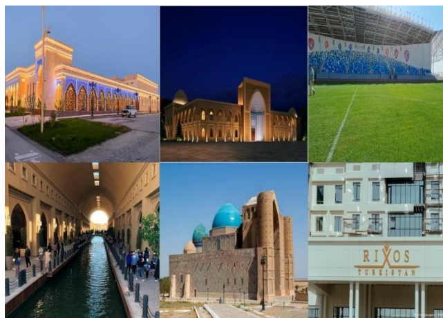
Сурет 1. Қазіргі Түркістан

Түп тамыры тереңде жатқан орта ғасырлық Түркістан өңірін көркейтуде беттік декоративті керамикалық плиткалар, табиғи және жасанды мрамор қиыршықтастары, сұйық травертин секілді заманауи құрылыс материалдары қолдану үстінде. Сонымен қатар ресурстық базасы кең және бағасы арзан шлак, өндіріс қалдықтар негізінен жасалған бұйымдарда жоқ емес. Тұрғын үй құрылысында экономикалық жағынан тиімді, экологиялық таза, жылуоқшаулағыш және акустикалық материалдар пайдалануда. Айта берсек қолданылып жатқан қазіргі материалдар өте көп. Олардың бұрынғы осыған дейін қолданылып келген құрылыс материалдарымен салыстырып, тиімділіктерін бағалап жатудың да қажеті жоқ. 2-суретте қала құрылысында қолданып жатқан заманауи құрылыс материалдары бейнеленген.