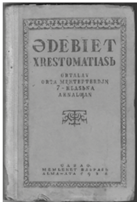
Әдебиет хрестоматиясы. Alma-ata, 1938

1940 жылғы 8-9-10 кластарға арналған «Әдебиет теориясы», орта мектептерінің 6 класына арналған «Әдебиеттік оқу кітабы», 1936 жылғы орта мектептерінің 5 класына арналған «Грамматика талдауы» кітаптары.