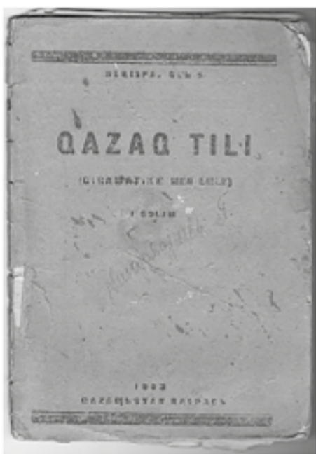
Кенеспай Улы. Қазақ тілі. 1933