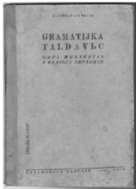
Сіямбай ұлы Сейіл. Граматика талдауы. Қазақстан баспасы, 1939

Сонымен қатар музей көрмесінен Сіздер 1908 жылы басылып шығарылған әлемдік көркем әдеби ескерткіштер қатарындағы Әбілқасым Фердоусидің «Шахнамесін», 1900-1940 жылдардағы орыс тіліндегі әдебиеттер, қалта кітаптары - «миниатюралық» баспаларын көре аласыздар.