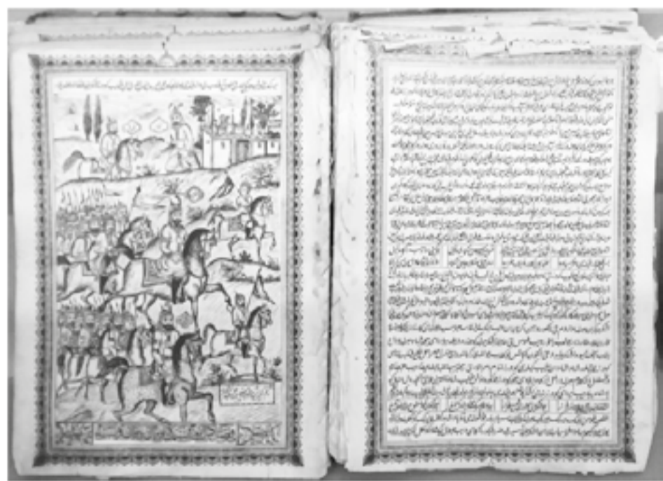
Әбілқасым Фердоуси «Шахнаме», 1908 ж.

Несмотря на тяжелое военное время, руководство Советского Союза заботилось о будущих кадрах послевоенного строительства. Совет Народных Комиссаров СССР постановлением № 679 от 19 июня 1943 года поручил Наркомату стройматериалов СССР и Всесоюзному Комитету по делам высшей школы организовать Технологический институт строительных материалов.