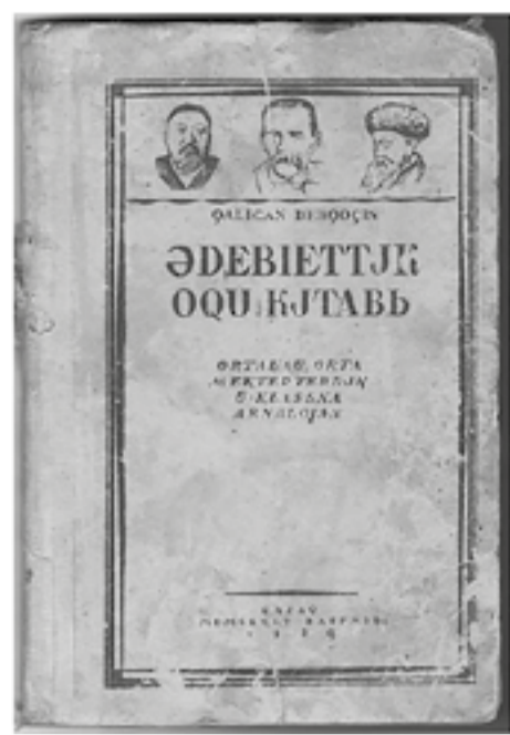
Қалиқан Бекқоқин. Әдебиеттік оқу кітабы. Alma-ata, 1939