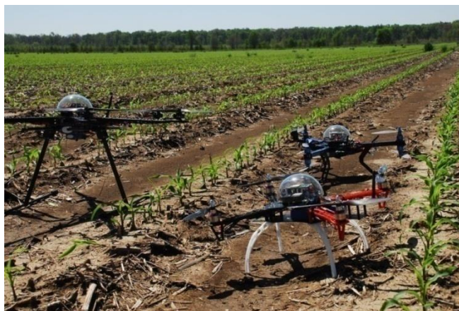
Рисунок 5. Умные технологии

Выводы. Таким образом, новейшие информационные технологии станут основой перехода общественного развития от индустрии мирового уровня к информационной эпохе [4,5]. Современные сельскохозяйственные технологии прокладывают путь к устойчивому будущему, в котором фермеры могут повышать производительность и сокращать отходы (рисунок 5).