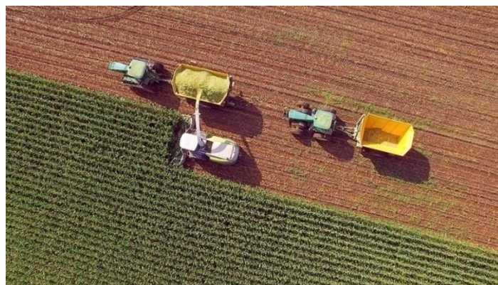
Рисунок 3. Управление уборки урожая

Урожайность культур на разных участках одного поля неодинакова. На величину многоплодной урожайности влияют следующие факторы: качество почвы (плодородие, кислотность, структура); дозы и виды применяемых удобрений; рельеф местности; наличие лесополос; посевная техника, уход и уборка урожая; качество семян; болезни и вредители сельскохозяйственных культур; погодные условия и многое другое. Сравнивая определенные характеристики поля с более продуктивными картами, специалисты по сельскому хозяйству могут определить причины неравномерной урожайности (одни части поля более продуктивны, чем другие).