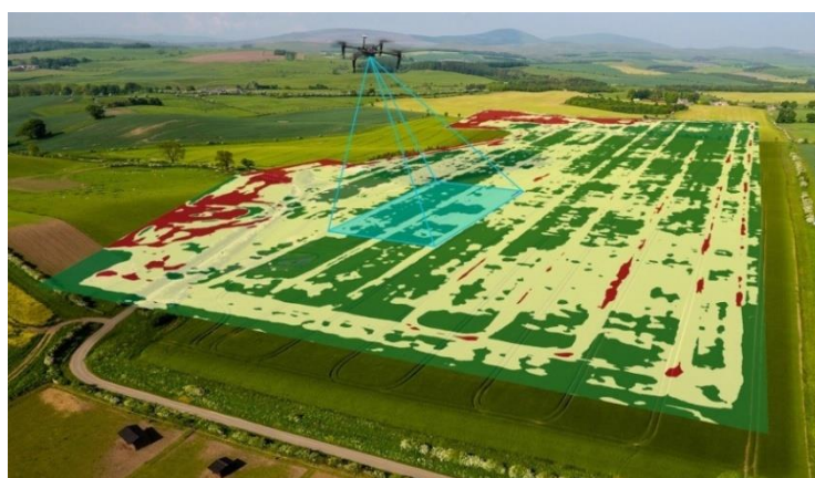
Рисунок 4. Использование беспилотников

Спрос на индустрию дронов будет продолжать расти за счет расширения сельскохозяйственного рынка - с 2,81 миллиарда долларов в 2014 году, который, по прогнозам, вырастет до 6,43 миллиарда долларов в 2022 году. Самолеты также играют важную роль в повышении производительности и прибыльности сельскохозяйственного сектора (рисунок 4).