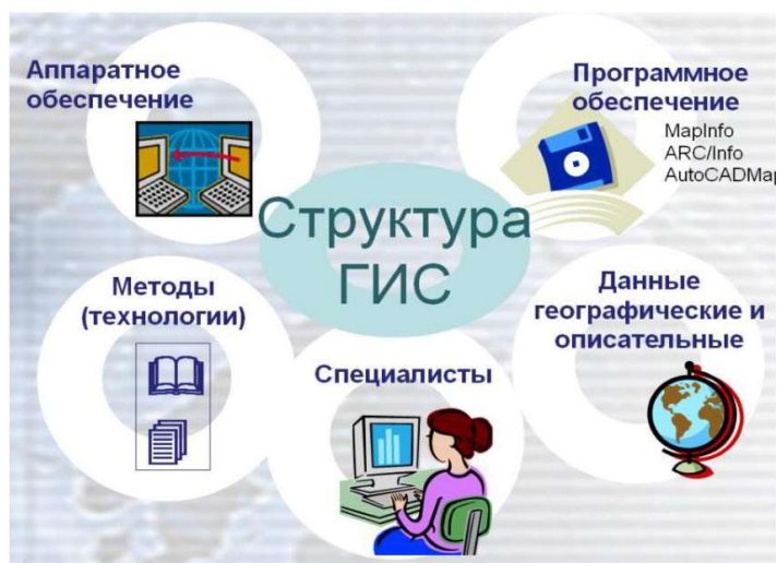
Рисунок 2. Структура ГИС

Работающая ГИС включает в себя пять ключевых компонентов: аппаратные включения, программное снабжение, спецданные, исполнители и методы (рис. 2).